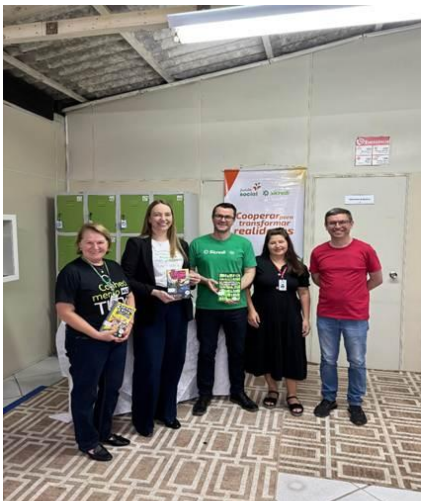
Premiações para alunos mais assíduos na Biblioteca durante o ano 2024.

Cunha, Pulcinelle e Marcelino (2020) afirmam que os incentivos Culturais, funcionam como um meio arrecadar recursos nos projetos apoiados pela Lei de Incentivo à Cultura, onde o investimento social pode ser uma ótima ferramenta de comunicação com seu público, as ações sociais agregam valor, causando impacto positivo na sociedade.