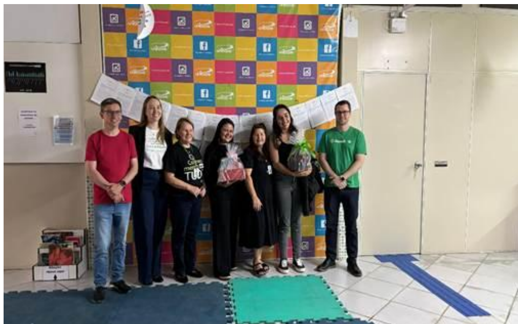
Hall da biblioteca, 2024.

recursos, bem como criar estratégias para que tanto as universidades como as empresas tomem conhecimento das opções de fomento disponíveis e estejam aptas a participar (Cunha e Cario, 2017).