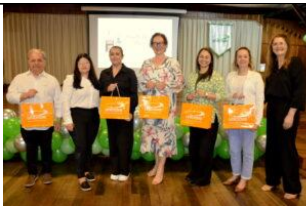
Centro de vivencias, 2024.