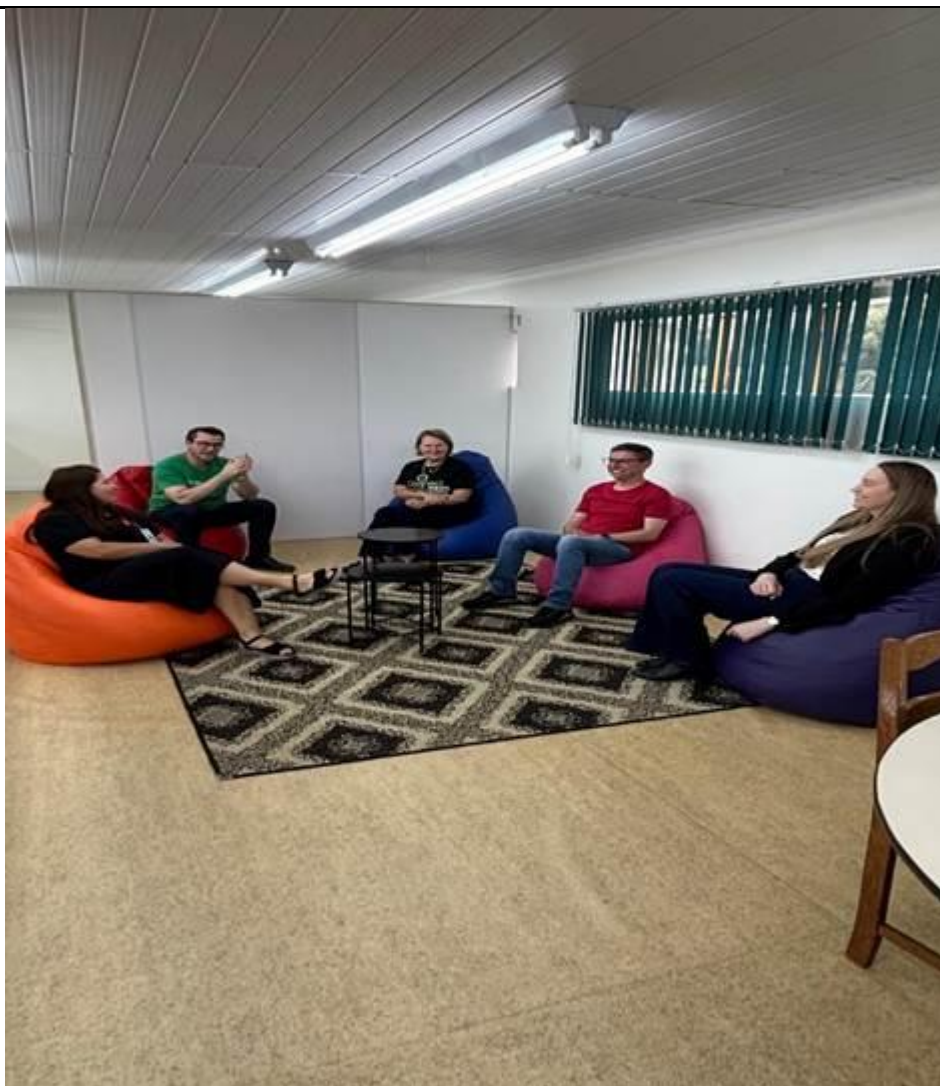
Espaço para leitura para os usuários da biblioteca piso superior.

Além da Inauguração da Sala de Leitura, tivemos um momento de Contação de Histórias. Onde a Contação de histórias permite o contato com diferentes linguagens e maneiras de contar um mesmo acontecimento já que amplia o vocabulário, colabora no desenvolvimento de habilidades socioemocionais e estimula a curiosidade, a imaginação e a criatividade.