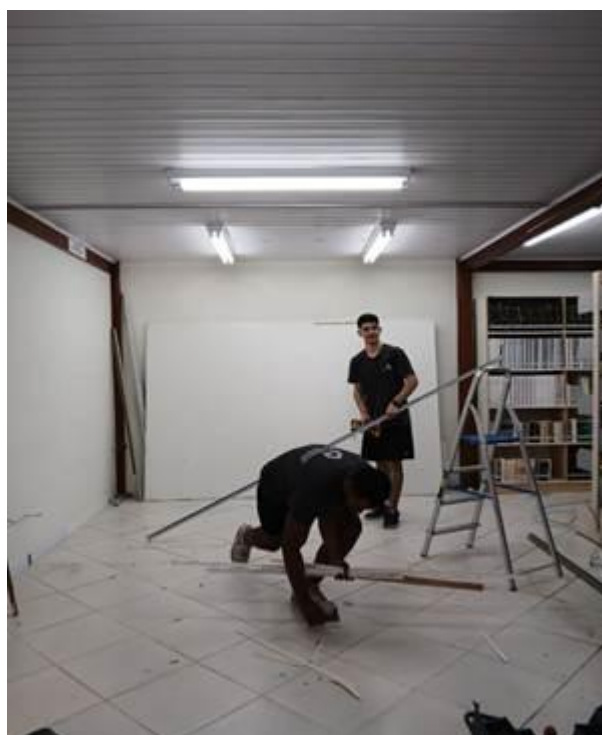
Construção da sala de leitura 2024

O Objetivo é incentivar à cultura, e acesso à informação, bem como: