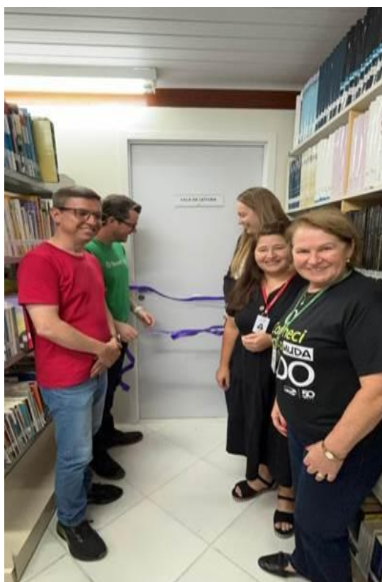
Inauguração da Sala de leitura, 2024.

Os alunos da graduação que mais emprestaram livros, durante o ano, na biblioteca, participaram da inauguração juntamente com a equipe da biblioteca e Sicredi.