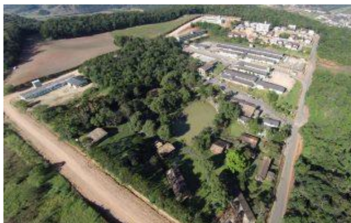
Figura 1 – Campus UNIBAVE Orleans – SC